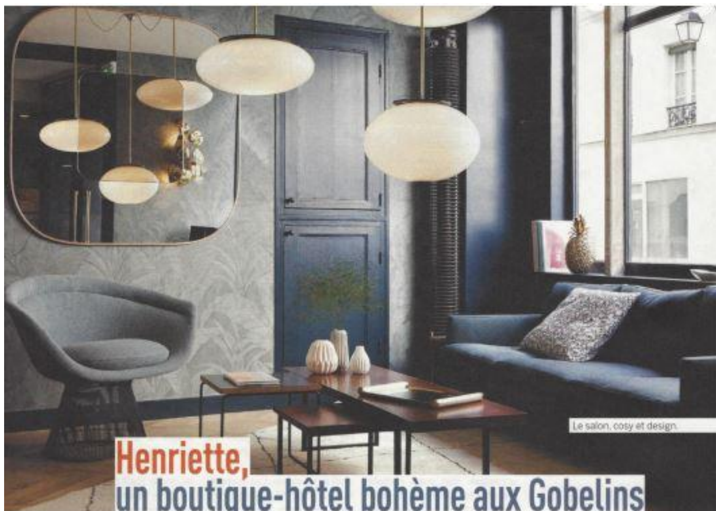
Le salon, cosy et design.