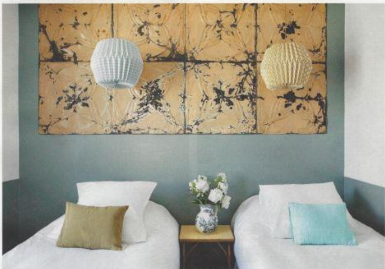
Une chambre twin.