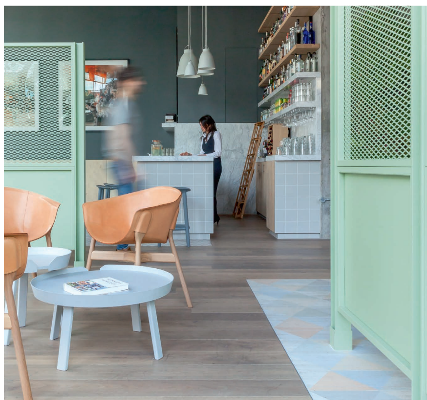
Flat Hotel 2.0 | URBAN VILLA

Le concept d'Urban Villa s'approche de celui de l'appart-hôtel: il combine service hôtelier et location en formule suite/studio full équipé. Parfaite pour des séjours un peu plus long qu'un week-end, la centaine d'unités qu'abrite le building déclinent un design contemporain aux lignes pures. Les espaces communs comprennent un agréable café/cantine, un bar, une salle de fitness, une buanderie... Excentré dans le West London, il n'y a pas de métro à proximité, mais une gare qui rejoint le centre de Londres à 5 minutes à pieds.