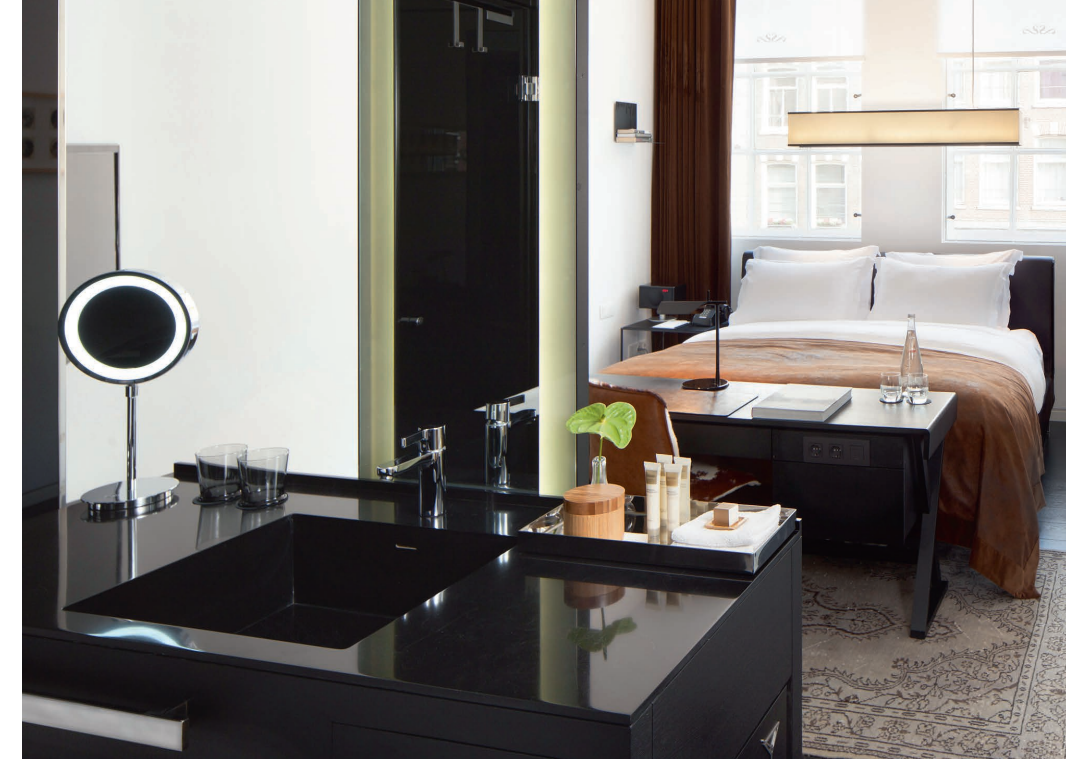
Amsterdam chic | SIR ALBERT

► Apd 143 euros la chambre double. Infos: www.siralberthotel.com