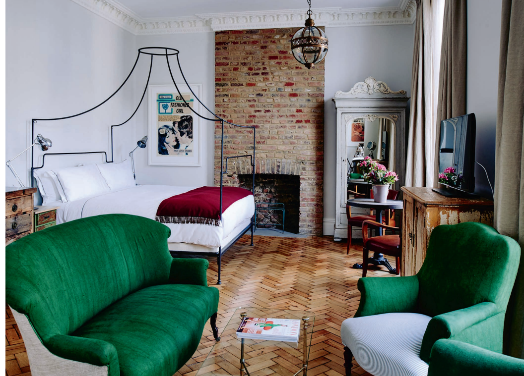
Arty cosy | ARTIST RESIDENCE

► Apd 180 £ la chambre double. Infos: http://artistresidencelondon.co.uk